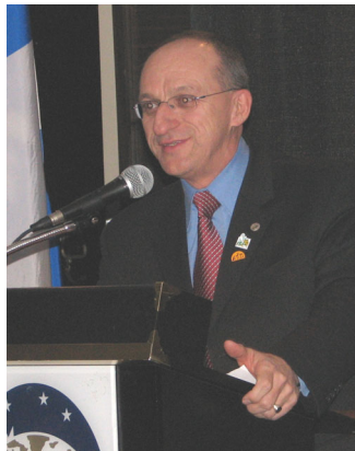
M. Yvon Vallières, ministre de l'Agriculture

À la demande de celui-ci, la FRAQ rencontrait, le 12 juin dernier, M. Yvon Vallières pour discuter de la fiscalité liée au transfert de fermes. D'emblée, celui-ci proposait à la FRAQ de dégager ses propres revendications dans ce dossier afin d'obtenir, dans le prochain budget provincial, des modifications tangibles favorisant l'établissement. Toutefois, le ministre souhaite éviter des mesures qui auraient pour incidence une augmentation de la valeur des fermes.