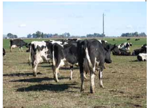
Paysage agricole typique de la province de Buenos Aires