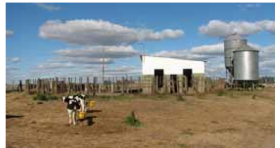
Un salon de traite, seul bâtiment se retrouvant sur les fermes laitières

Les trois exploitations laitières visitées comprenaient entre 150 et 250 vaches avec une production annuelle de 5 000 litres de lait, ce qui correspond à la moyenne nationale. Les exploitations misent sur le pâturage pour subvenir aux besoins alimentaires de la vache avec un minimum de suppléments. En hiver, la température oscille entre 0° C et 10° C, diminuant ainsi la qualité du pâturage et obligeant l'utilisation de fourrage.