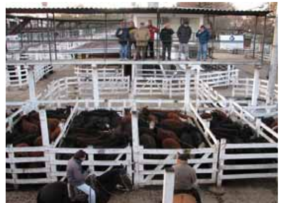
Encan de bovins à Buenos Aires avec plus de 3 000 têtes par jour