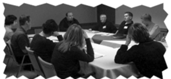
Table ronde lors du 2 ème forum en 2003.